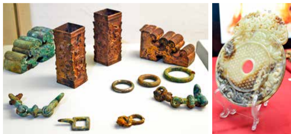
Некоторые экспонаты выставки